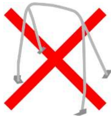
■リア4点式ロールケージは禁止