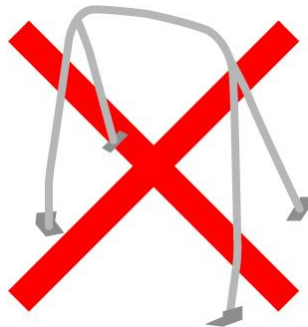
■リア4点式ロールケージは禁止